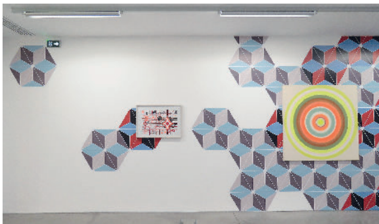
Un musée à soi

d'une performance dansée lors de la visite VIP du 27 novembre. À ne pas rater.