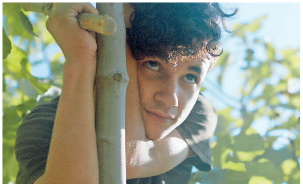
Sous les figues

Brakni et Éric Cantona . Neuf films sont en lice pour l'Antigone d'or, venus du Liban, de Tunisie, du Maroc, d'Italie, d'Algérie, de Palestine, d'Espagne et de France. Parmi les cinéastes présents, quelques « habitués » : Wissam Charaf (invité en 2016), revient avec son nouveau film, Dirty, difficult, dangerous . Damien Ounouri , dont le projet de film avait été retenu en 2017 présente La Dernière Reine , coréalisé avec Adila Bendimerad . Hicham Ayouch , sélectionné en 2006 pour Tiza Oul sera présent pour son (suite p.2)