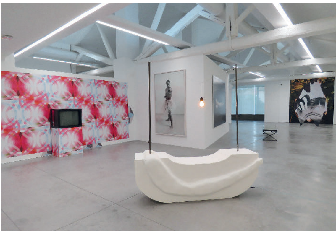
Un musée à soi