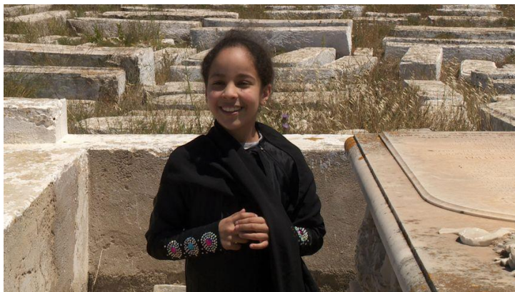
Ziyara - Simone Bitton

Son travail témoigne d'un engagement humain et professionnel pour une meilleure appréhension de l'actualité, de l'histoire et des cultures d'Afrique du Nord et du Moyen-Orient. Son engagement est aussi celui de la rigueur formelle et du regard personnel assumé. Cinemed vous présente entre autres Ziyara (2020), road movie-pèlerinage au pays natal à la rencontre des gardiens musulmans de sa mémoire juive.