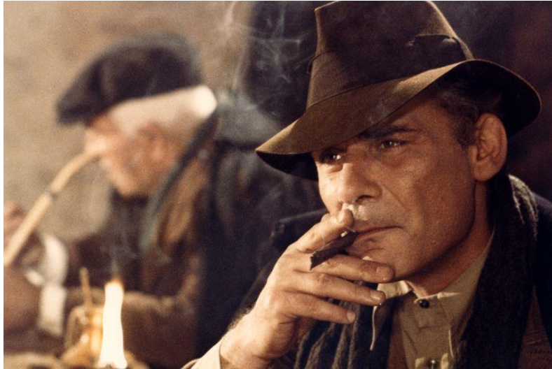
Le Christ s'est arrêté à Eboli de Francesco Rosi – Gaumont

► Vous pourrez aussi découvrir des films en avant-première dont :