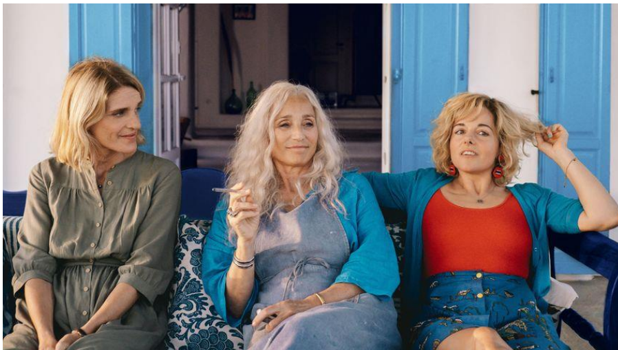
Les Cyclades de Marc Fitoussi - Chloe-Kritharas

...tandis que la soirée de clôture vous proposera Les Cyclades de Marc Fitoussi samedi 29 octobre avec dès 19h la cérémonie du palmarès toujours au Corum - Opéra Berlioz.