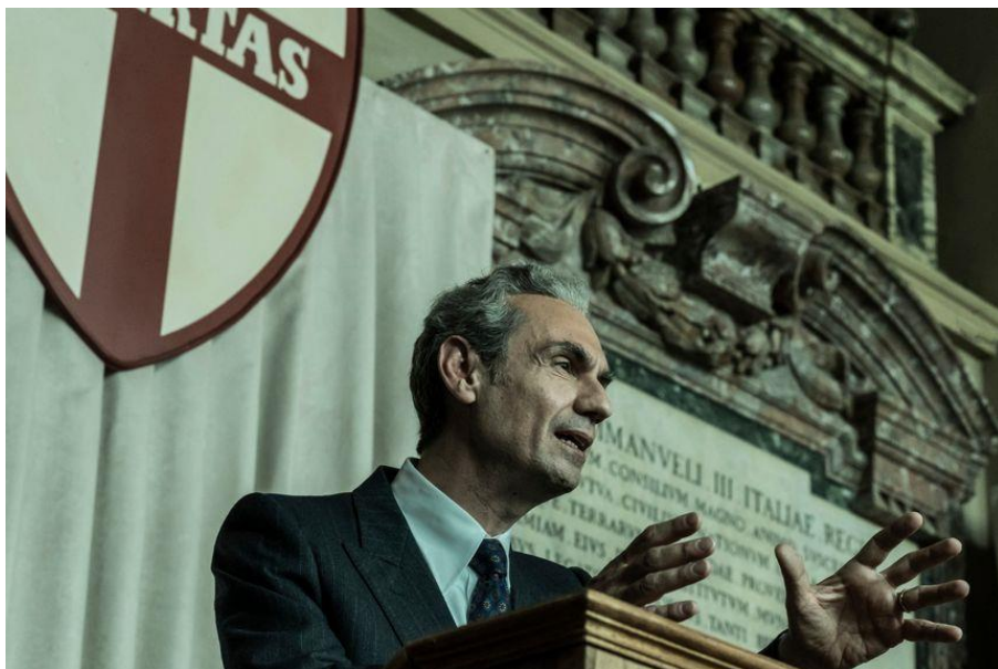
Esterno Notte de Marco Bellocchio - séance spéciale série @ARTE

1978, l'Italie est déchirée par une guerre civile. D'un côté les Brigades Rouges, la principale organisation terroriste armée d'extrême gauche, et de l'autre l'État. Pour la première fois dans l'histoire d'un pays occidental, un gouvernement soutenu par le Parti communiste est sur le point d'arriver au pouvoir par une alliance avec le bastion du conservatisme italien, la Démocratie chrétienne (DC). Aldo Moro, Président de la DC, principal partisan de cet accord est enlevé par les Brigades Rouges le jour où la nouvelle formation gouvernementale prête serment. Sa détention durera 55 jours : 55 jours d'espoir, de peur, de négociation, d'échecs, de bonnes intentions et de coups tordus. 55 jours au bout desquels son corps est retrouvé dans le coffre d'une voiture à Rome, à mi-chemin du siège de la DC et celui du PCI.