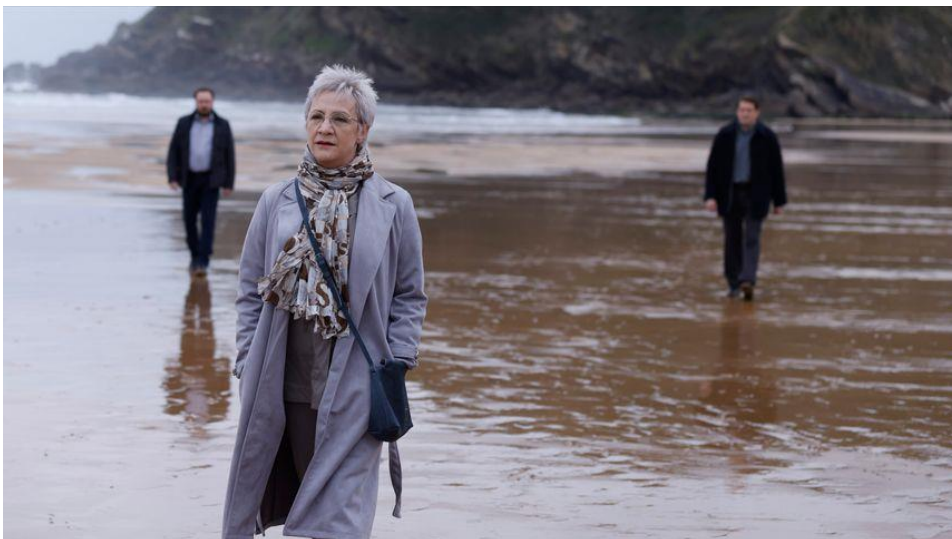
Les Repentis - Icíar Bollaín