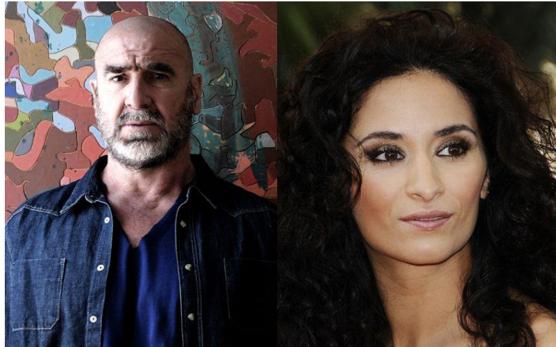
Rachida Brakni et Éric Cantona, Présidents du jury de l'Antigone d'or

Lui, footballeur né à Marseille, adulé outre-Manche, s'est révélé être un acteur remarquable ; elle, née de parents algériens, douée autant pour la musique que le cinéma, pensionnaire de la Comédie française, s'est vite imposée en tant que comédienne et réalisatrice.