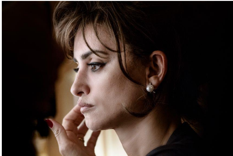
L'immensità - Emanuele Crialese / Pathé