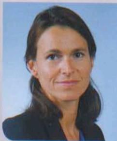
PRÉSIDENTE DE CINEMED