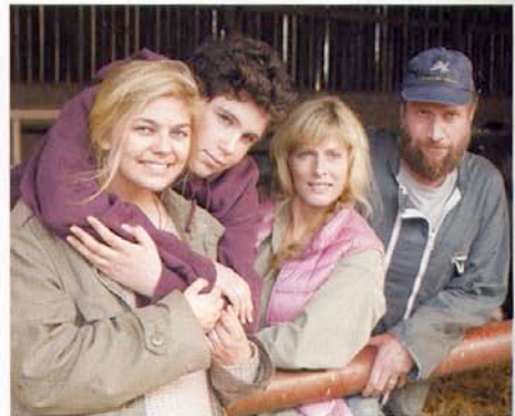
La Famille Bélier avec la jeune chanteuse Louane