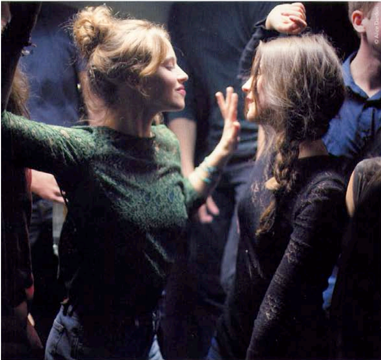
Respire de Mélanie Laurent