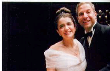
La comédie noire Les nouveaux sauvages

rendez-vous attendu des amateurs de séries B, la Nuit en Enfer , avec des zombies, à voir au second degré !