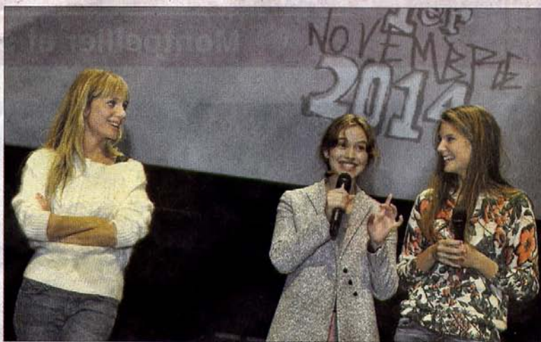
■ Mélanie Laurent et ses deux actrices, Lou de Laâge (au centre) et Joséphine Japy.

Elle confia ainsi, de sa belle voix grave et perchée sur dix centimètres de talons, son émotion et sa joie, non seulement de retrouver les décors et paysages où elle a filmé son histoire (qui s'attache aux pas de deux adolescentes), mais aussi de revoir les visages et sourires de techniciens ou acteurs qui ont