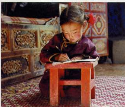
Le Chien jaune de Mongolie