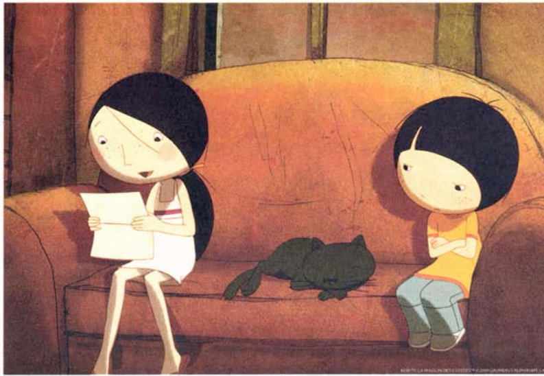
Kérity, la maison des contes sera projeté lors du festival jeune public.

Intitulé Festival jeune public, cette manifestation s'adresse aussi à certains enfants des centres de loisirs et des maisons pour tous. L'équipe du Cinémed assure la programmation faite autour de huit films : La Véritable histoire du chat botté (2009) de Pascal