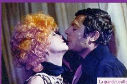
La grande bouffe

elle a participé. Elle viendra à Montpellier commenter sa carrière et son travail en nous faisant redécouvrir les grands films auxquels elle a collaboré.