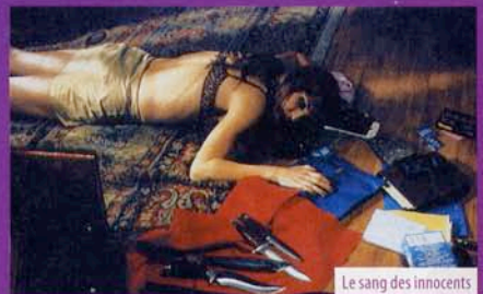
Le sang des innocents

à Montpellier pour un « regard croisé » sur le cinéma méditerranéen et sur l'image de la femme en Méditerranée.