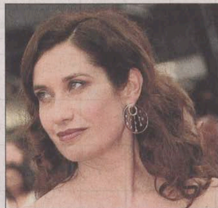
En haut Théo Angelopoulos , Julie Gayet , Emmanuel Mouret . En bas François Dupeyron , Jean-Paul Rappeneau et Emmanuelle Devos .