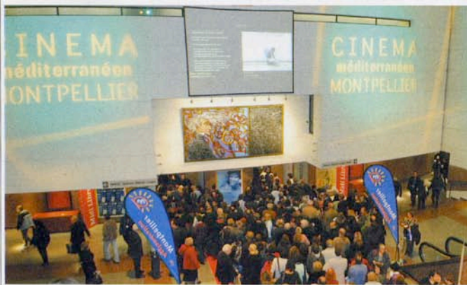
86 500 personnes ont assisté l'an passé au festival Cinemed. Ici, à l'opéra Berlioz du Corum.