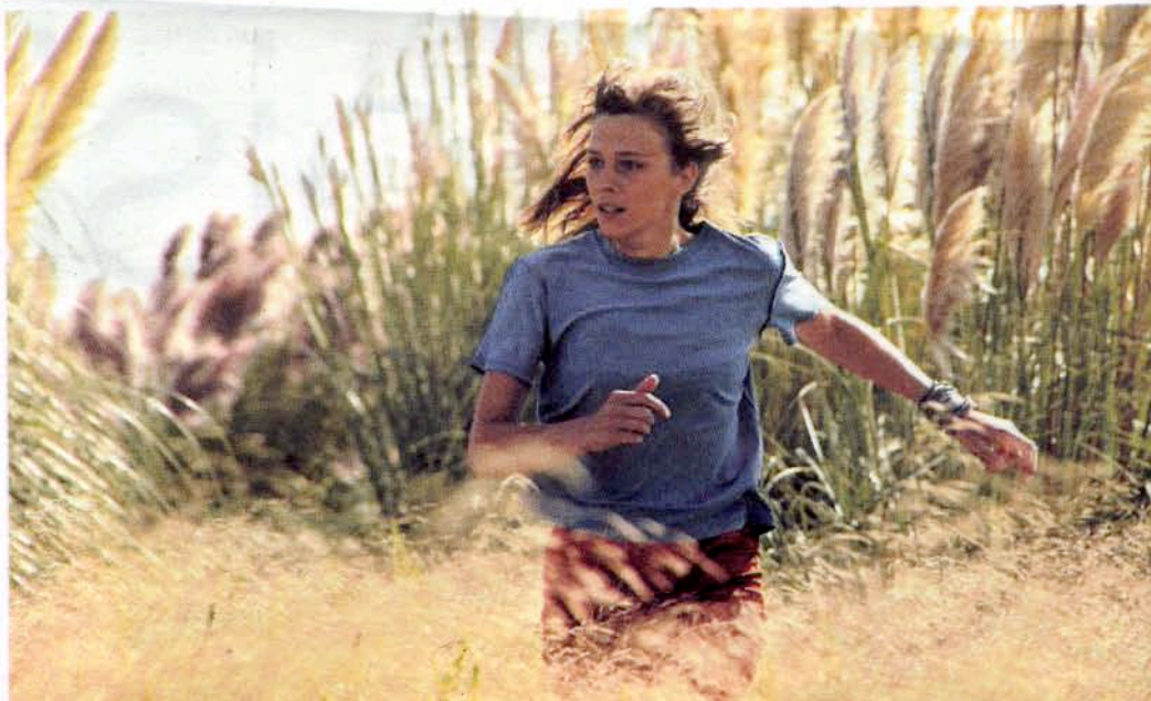
"Geronimo", le dernier film de Tony Gatlif, figure parmi les 12 longs métrages retenus pour la rétrospective qui lui est consacrée. Autre temps fort de ce coup de chapeau : un concert - gratuit ! - de l'actrice et chanteuse Rona Hartner mardi soir au Rockstore.

Le 37 e Cinemed qui se tient du 24 au 31 octobre à Montpellier va faire le tour des cinématographies du bassin méditerranéen. Raretés, inédits, avant-premières, films restaurés, tables rondes... Une édition annoncée de "transition" qui ne change rien à son exigence d'excellence.