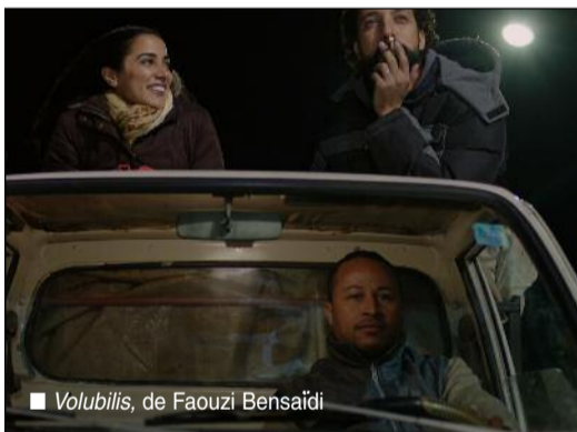
Volubilis, de Faouzi Bensaïdi

1992. Dans la ville où réside Dina, la tradition