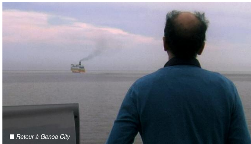
Retour à Genoa City

Plus d'articles, d'interviews et de contenus sur http://www.hautcourant.com Le site web du Master 2 de science politique Métiers du Journalisme de l'Université de Montpellier.