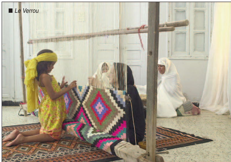
■ Le Verrou

Filmer en région, mardi 25 octobre, au Centre Rabelais. Programme n°1, à midi : Jamais ensemble de Nadja Harek, Ad Astra de Lauric Bonnemort, Clémentin Massin et Pierre Vallerich, Brûle cœur de Vincent Tricon, Luttopia vivra de Mossi Soltan et Christel Lescrainier, L'Architecte de Saint-Gaudens de Serge Bozon et Julie Desprairie. Programme n°2, à 16 h : La Fontaine de l'amour d'Adeline Boit et Les Frères Fayet de Sonia Séjourné.